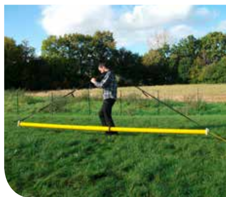
Referentiefoto geotechnisch onderzoek