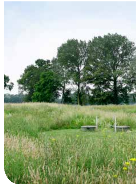
Zoekgebied nieuwe drinkwaterwinning

Alleen samen kunnen we ervoor zorgen dat iedereen - nu en in de toekomst - kan genieten van een schone leefomgeving en daarmee van kraanwater van de hoogste kwaliteit.